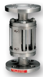
型式 - PS3