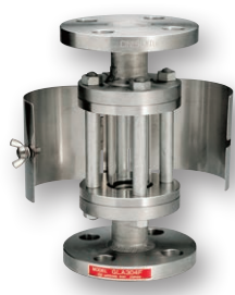
型式 - PH